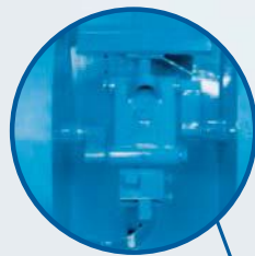
Gruppo mole Sistema de trituración

Molazza per malta Trituradora de mortero